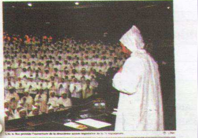
Le Roi présente l'exposé de la doctrine de son régime de la 1 ère session

Le projet de Code de la Famille a été présenté au Parlement par le Roi Mohammed VI. Le Souverain a souligné que ce projet de loi vise à garantir l'équité, la justice et la protection des droits des femmes, des enfants et de l'homme. Il a également insisté sur l'importance de préserver la dignité de l'homme et de renforcer la culture de la citoyenneté.