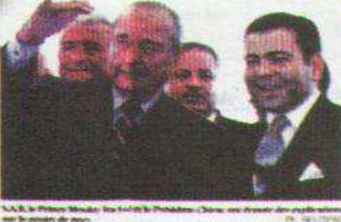
S.A.R. le Prince Moulay Rachid et le Président français Jacques Chirac lors de leur visite au port de Tanger-Méditerranée.

Le Prince Moulay Rachid et le Président français Jacques Chirac ont visité le port de Tanger-Méditerranée. Le Président français a souligné l'importance de la Méditerranée comme espace de coopération et de dialogue entre les nations.