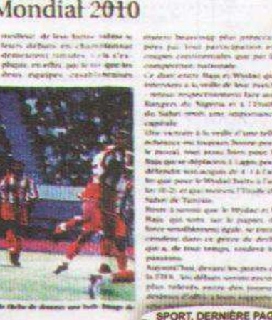
Le Raja et le Wydad en action lors de la demi-finale de la Coupe du Trône de football.

Le Raja et le Wydad se affrontent en demi-finale de la Coupe du Trône de football. Les deux équipes sont considérées favorites pour remporter le trophée. Le match sera joué à l'heure du Mondial 2010.