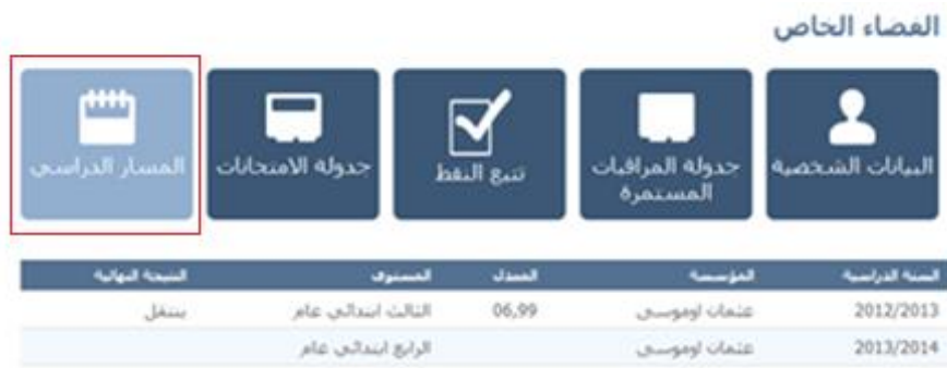
Figure 13 : Historique de l'enfant.