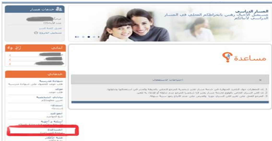
Figure 255 : Aide en ligne.

En termes d'assistance, une page d'aide est accessible depuis d'espace privé.