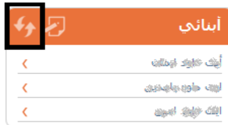
Figure 15 : Icône de Mise à jour de la liste des enfants