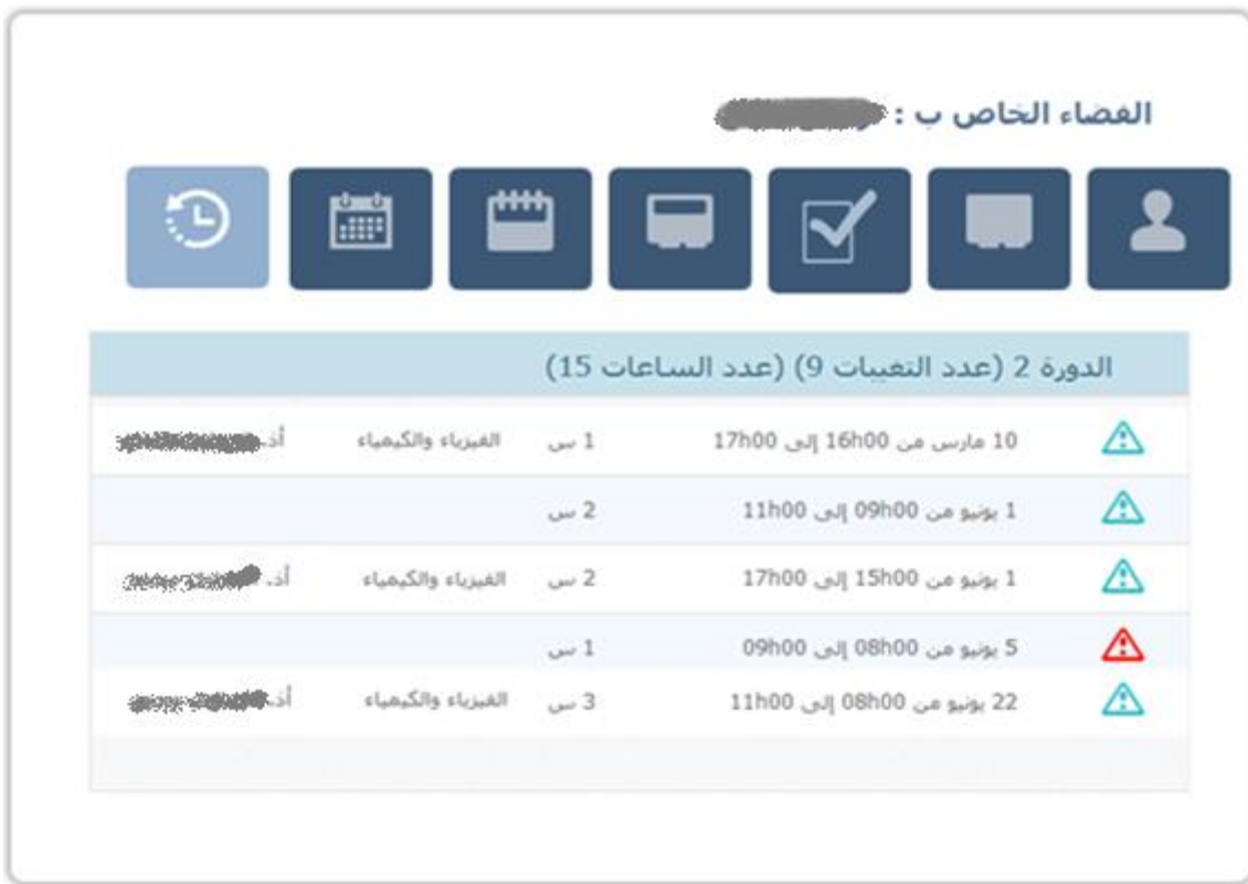
Figure 244 : liste des absences.

La liste des absences est disponible par session.