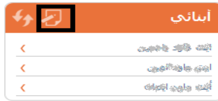
Figure 17 : Icône pour faire la réclamation

a) Ajouter un enfant : On doit saisir le code élève qu'on veut attacher.