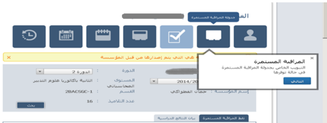
Figure 30 : visite guidée-infobulles.