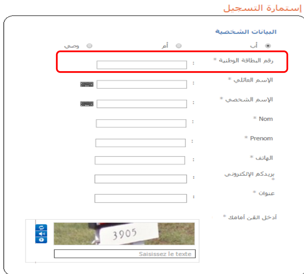
Figure 2.a : Inscription - Informations Tuteur

Etape 2 : Pendant le premier accès, il sera demandé de remplir les informations du tuteur notamment les champs obligatoires marqués par Astérisque * : surtout veiller à bien saisir le N° de la carte d'identité nationale(CIN) pour les parents qui seront connectés avec le Code unique de leurs enfants (CUE).