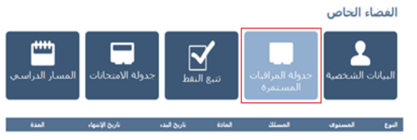
Figure 14 : Planning des examens.