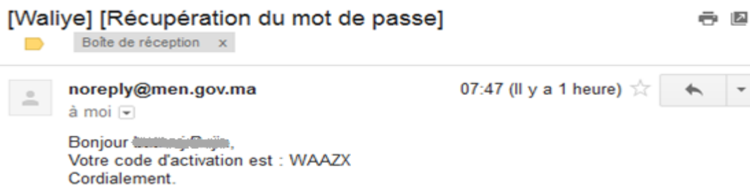
Figure 9 : Mail de récupération de mot de passe.