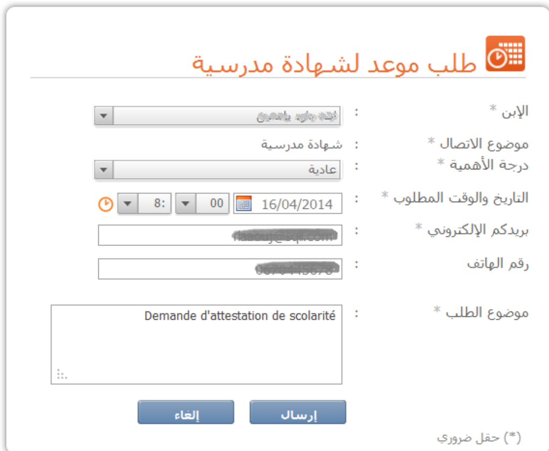
Figure 20 : Demande de RDV pour l'attestation de scolarité.