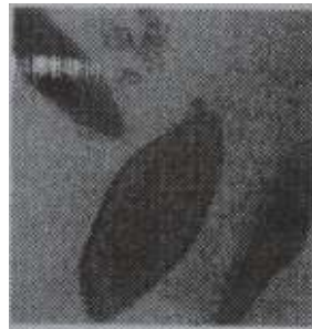
الصورة 3: براميسيوم (X400)