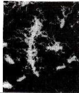
الصورة 2: عصيات حمى التفويد (X5000)