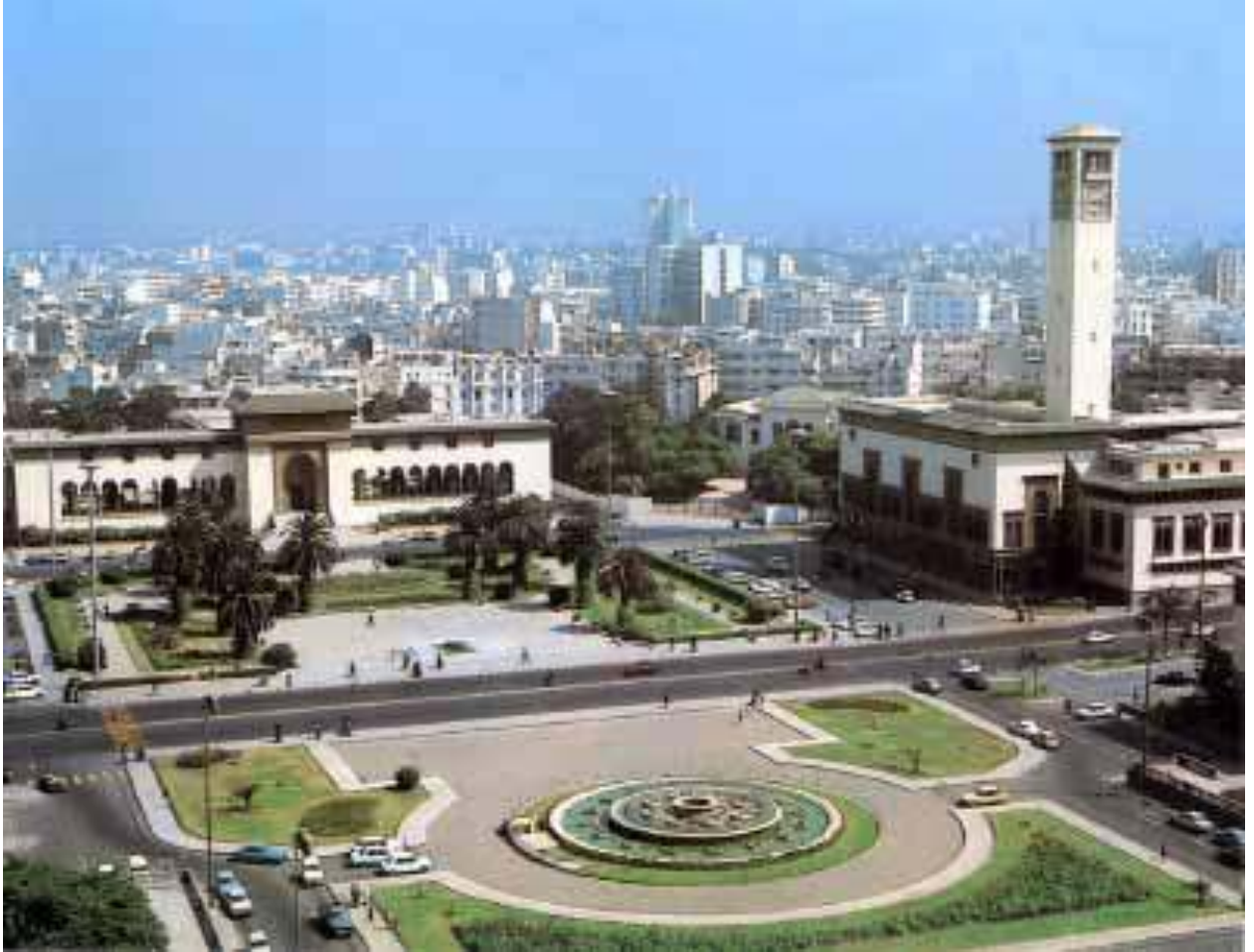
Vue de la Place Mohamed V, Casablanca (Espace à aménager)