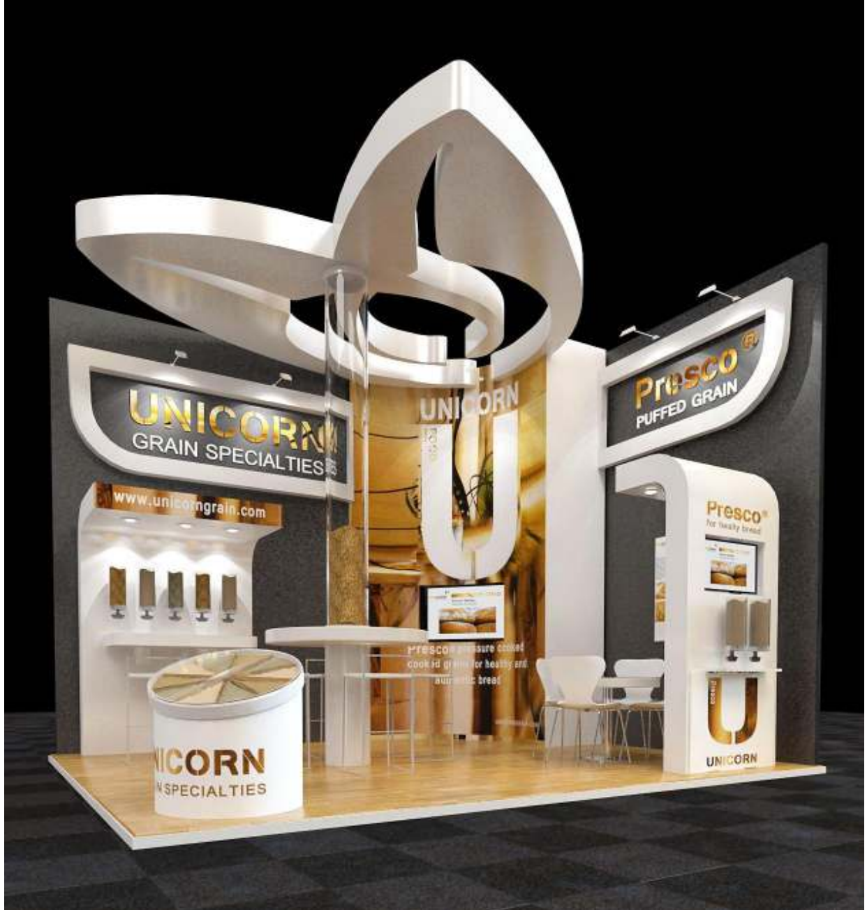
UNICORN : spécialiste dans la production et la commercialisation des produits à base de céréales