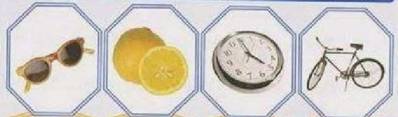
النظارة النظارة الليمون الليمون الساعة الساعة الدراجة الدراجة