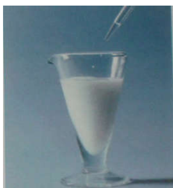
Fig. 5. Précipité de chlorure d'argent AgCl

▪ L'expérience montre que les dihalogènes Cl_2 , Br_2 , et I_2 réagissent vivement avec l'aluminium métal (figure 2, 3 et 4) pour former les trihalogénures d'aluminium AlCl_3 , AlBr_3 et AlI_3 .