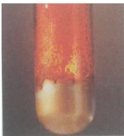
Fig. 3. Réaction entre le dibrome et l'aluminium. On laisse tomber quelques gouttes de dibrome liquide Br_2 sur de l'aluminium en poudre ; on observe alors de vives incandescences. Il y a formation de tribromure d'aluminium AlBr_3