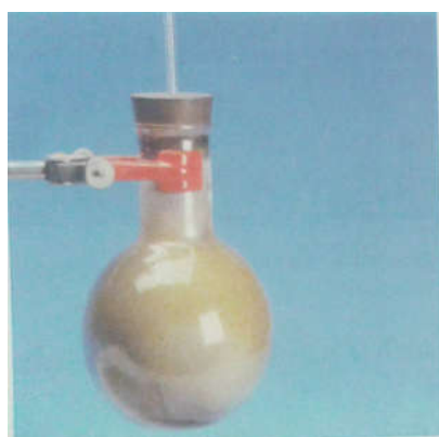
Fig. 2. Réaction entre le dichlore et l'aluminium. Le ballon contient du dichlore (gaz) et de l'aluminium en poudre. Quand on chauffe, l'aluminium réagit vivement avec le dichlore. On obtient du trichlorure d'aluminium AlCl_3