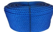
Corde en polyéthylène (PE)