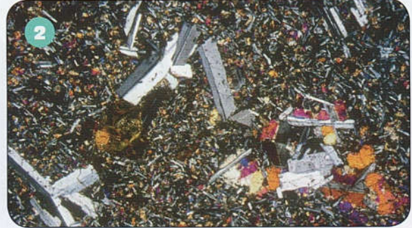
DOC 2 : Lame mince du basalte observée au microscope en lumière polarisée