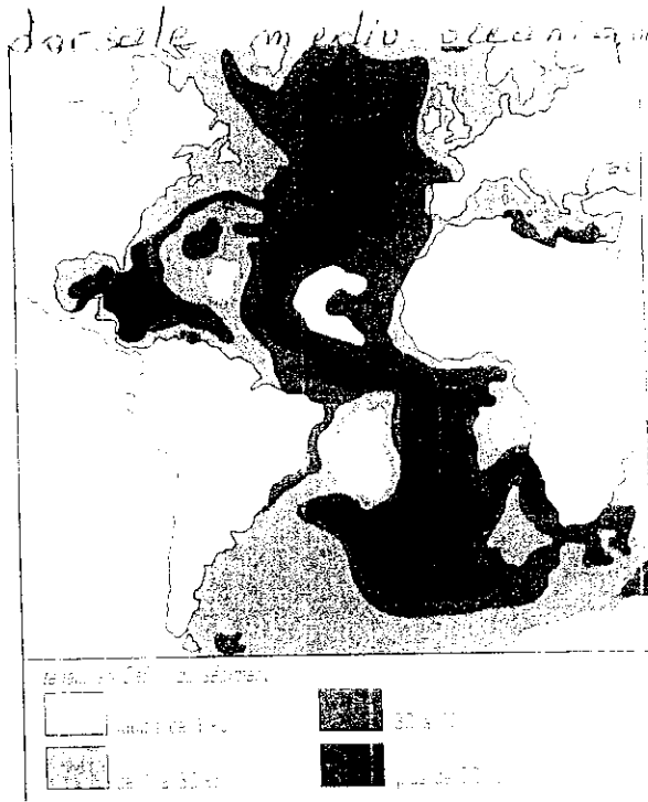
a. Répartition actuelle des boues carbonatées.