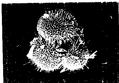
b. Une Globigérine