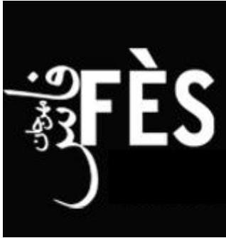
Logo du festival