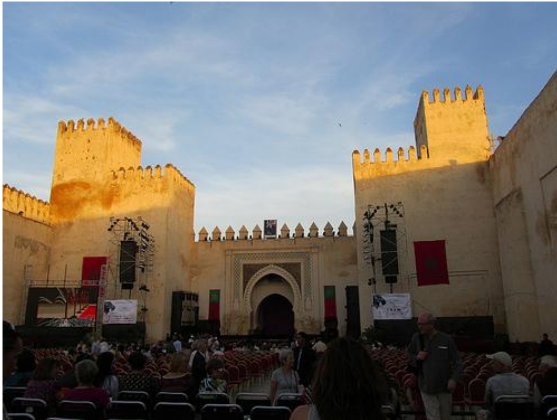
Bab Al Makina – Fès, Lieu officiel du festival