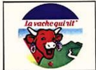
(SFX : Rire façon Salvador)