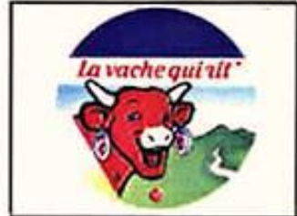
(SFX : Rire façon Salvador)