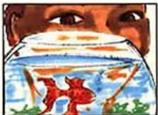
Enfant : "Pourquoi ils sont rouges les poissons rouges"