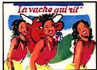
Chœur : "Parce que vache qui rit !"