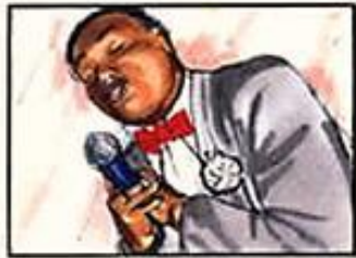
Crooner ringard : "Pourquoi m'as-tu quitté, pourquoi..."