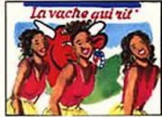
Chœur : "Parce que vache qui rit !"