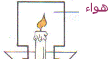
احتراق الشمعة في الهواء