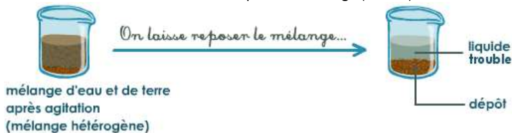
Doc. 1. Principe de la décantation.

La décantation consiste seulement à laisser reposer le mélange (doc. 1.) :