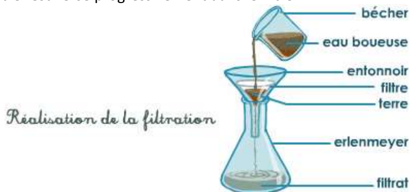
Doc. 3. Principe de la filtration.

Le mélange à filtrer est versé progressivement dans le filtre :