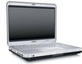
الحاسوب : منفعة