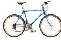
الدراجة : منفعة