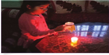
🔥 الوفيقة 1 : رتاج نشتعلت لتكس كاس فزق شمعة.

انقطع التيار الكهربائي، فأشعلت رتاج شمعة و لما احست بان دخانها يضايقها، نكست فوقها كأس زجاجية، حينها بدأت شعلة الشمعة في الاضمحلال