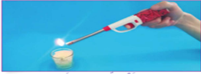
🔥 الوفيقة 2 : قداحة بجانب شمعة.

- أقوم بإشعال قداحة ثم يطلب من كل منسق للمجموعات عن طبيعة الإحساس الذي يشعر به عند وضع يده قرب لهب القداحة مع أخذ الاحتياطات عند تناولها. - يلاحظ المتعلمون والمتعلمات المناولة أو وثيقة كتاب المتعلم (ة). - أ طرح مجموعة من الأسئلة للتواصل لنوع الطاقة التي توفرها القداحة و شرط احتراق الشمعة.