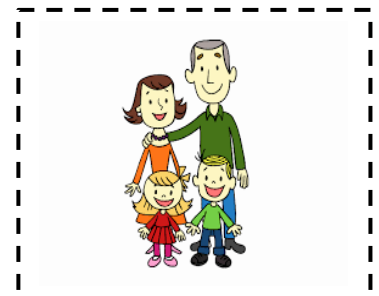
La f amille