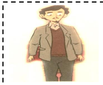
Le p apa