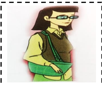
La m aman