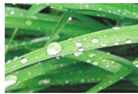
Formation de la rosée