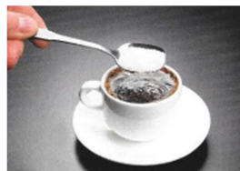
Dissolution de sucre dans du café