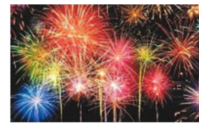
Explosion de feux d'artifice