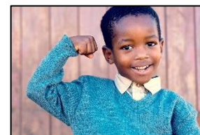
Article 371-1 du code civil